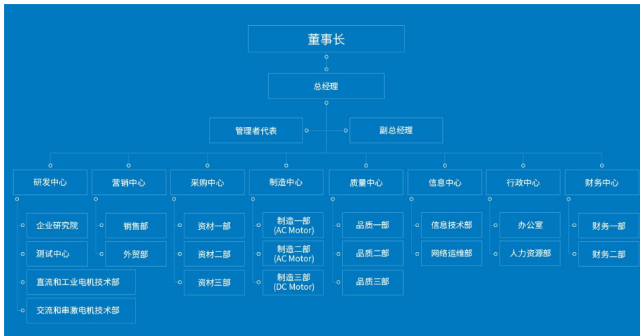
图 1：绿色供应链专项工作组